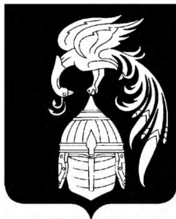
СХЕМА ТЕПЛОСНАБЖЕНИЯ ЮЖСКОГО ГОРОДСКОГО ПОСЕЛЕНИЯ ЮЖСКОГО МУНИЦИПАЛЬНОГО РАЙОНА ИВАНОВСКОЙ ОБЛАСТИ