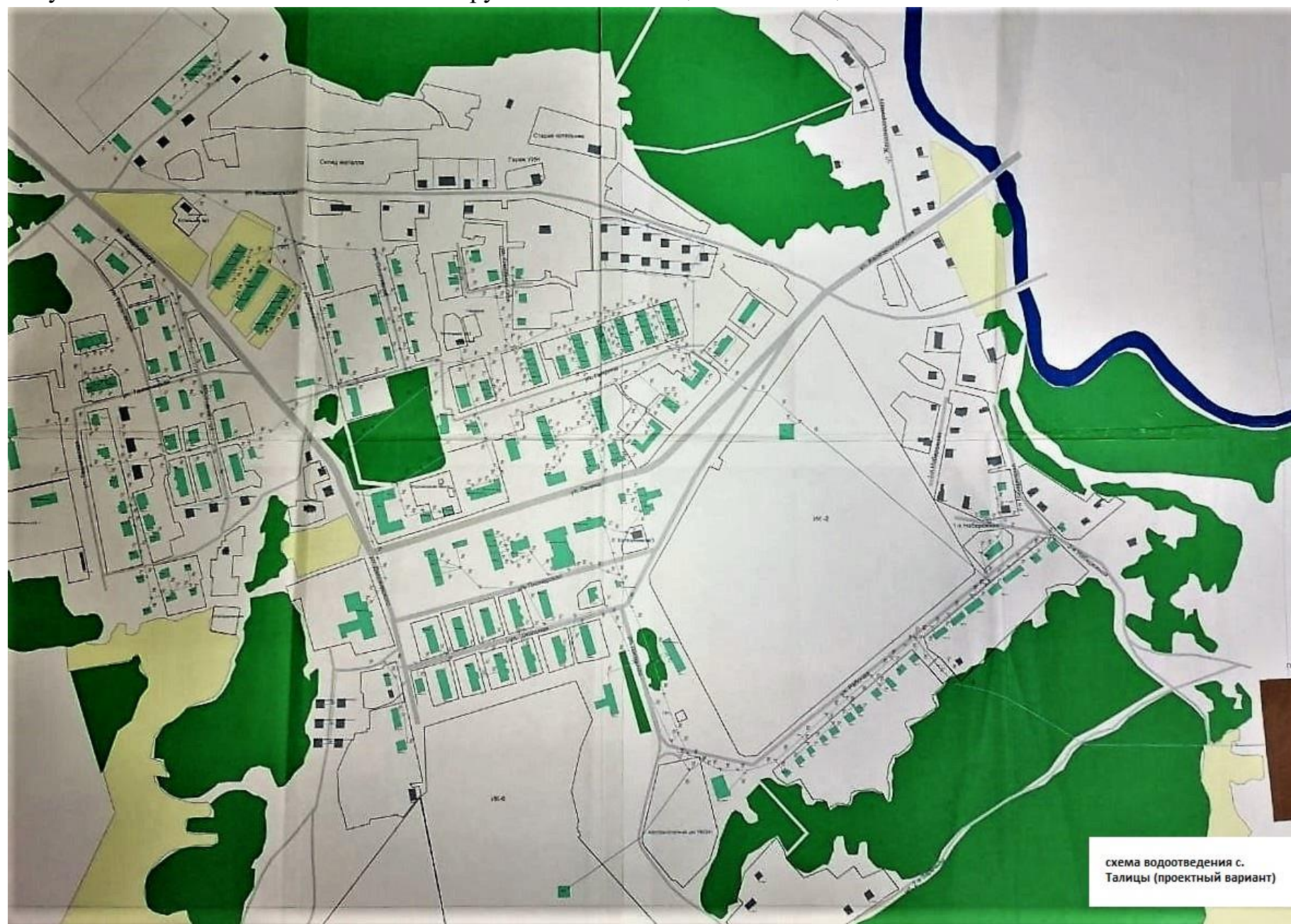
Рисунок 4.7.1. Расположение сетей и сооружений канализации в с. Талицы