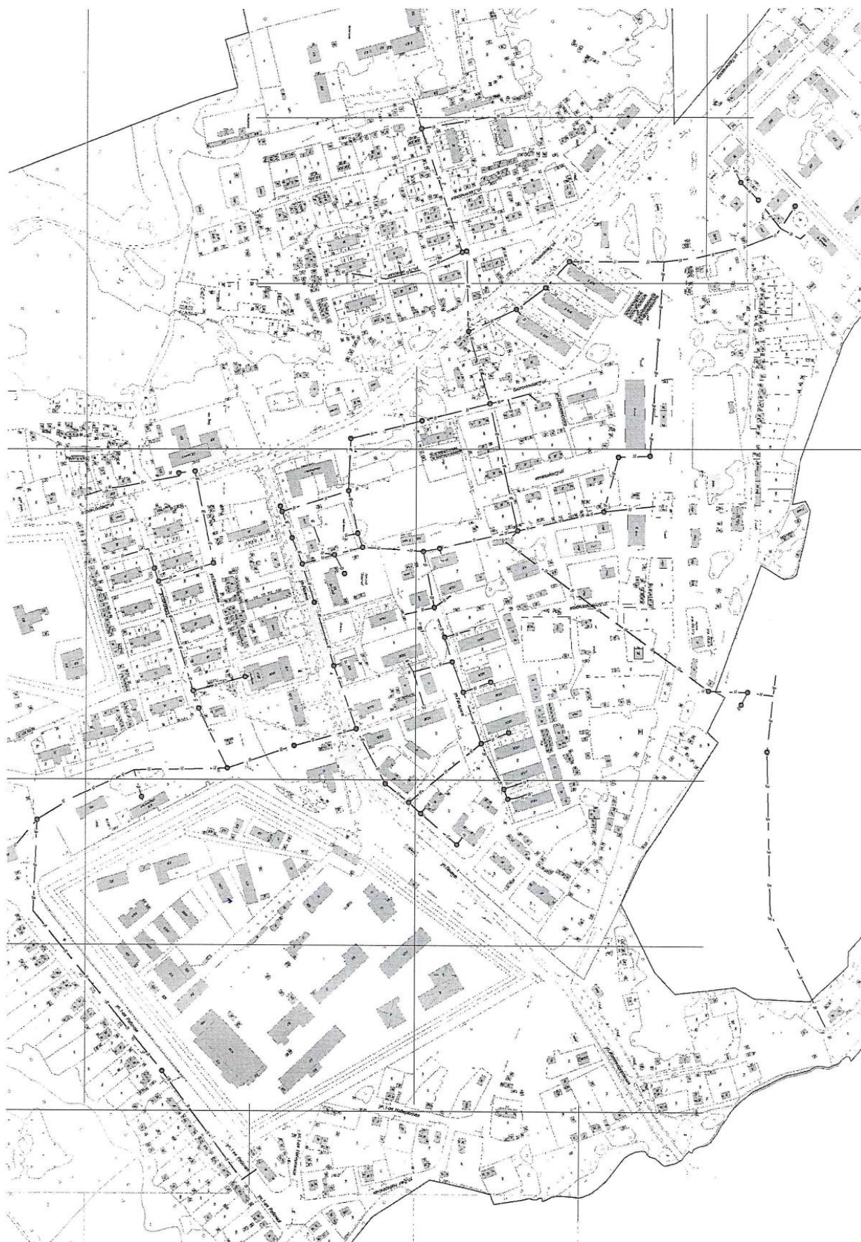
Рисунок 1. Карта (схема) объектов централизованных систем водоснабжения с. Талицы